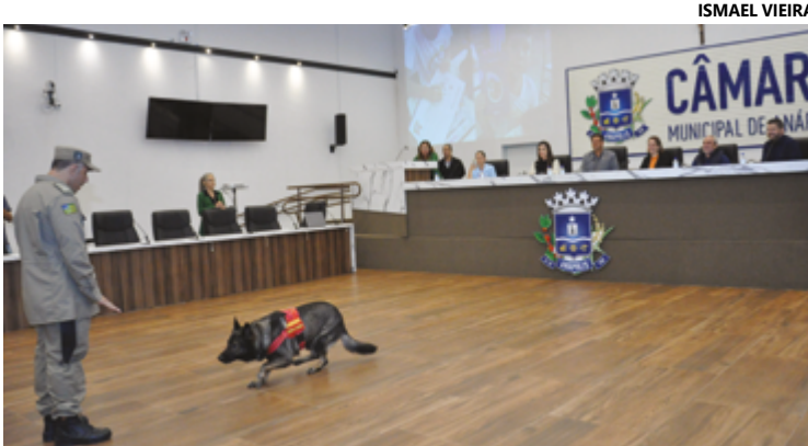
Cães de busca dos Bombeiros se apresentaram durante o ato de lançamento

A cartilha tem 16 páginas. Nas primeiras traz orientações sobre o bem-estar animal. Chama atenção para fatores como saúde, harmonia e tranquilidade, além de assegurar uma vida digna aos animais. E destaca a Regra das 5 Liberdades: livre de fome e de sede; livre de dor, de ferimentos ou de doenças; livre de desconforto; livre de medo e de estresse; e livre para expressar o seu comportamento natural.