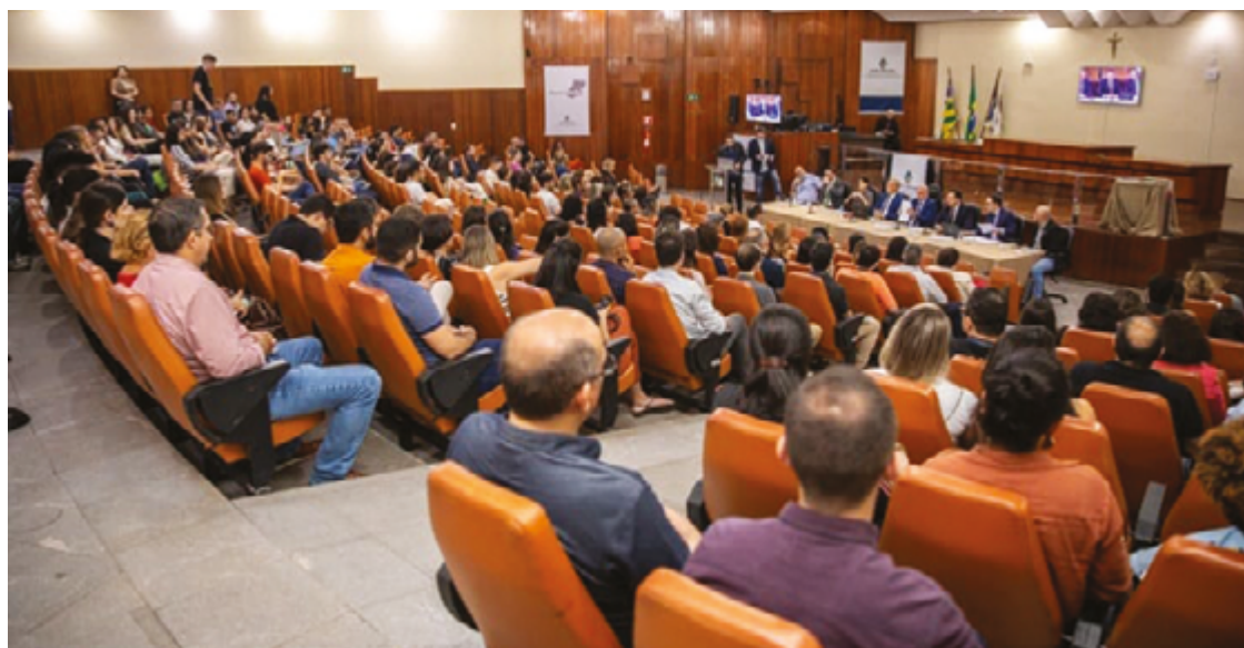
Corregedoria-Geral de Justiça fez compromisso de atuar para atender a sociedade e dos profissionais do direito