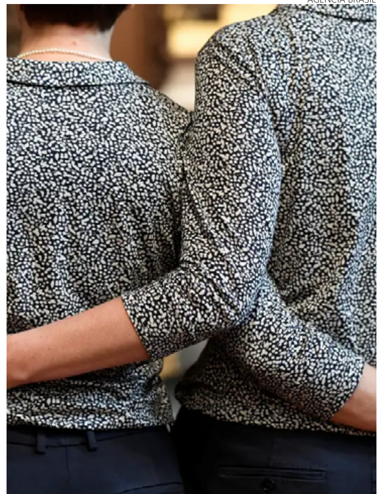
Casamentos de pessoas do mesmo sexo registraram aumento de 27,8% entre os anos analisados pelo IBGE

Em Goiânia, a diferença em percentual foi maior: foram 9.722 óbitos em 2022, 13.233 casos em 2021 e 10.611 em 2020, representando queda de 26,5% na comparação com 2022/2021. No país, essa redução foi menor, -15,7% na relação 2022/2021.