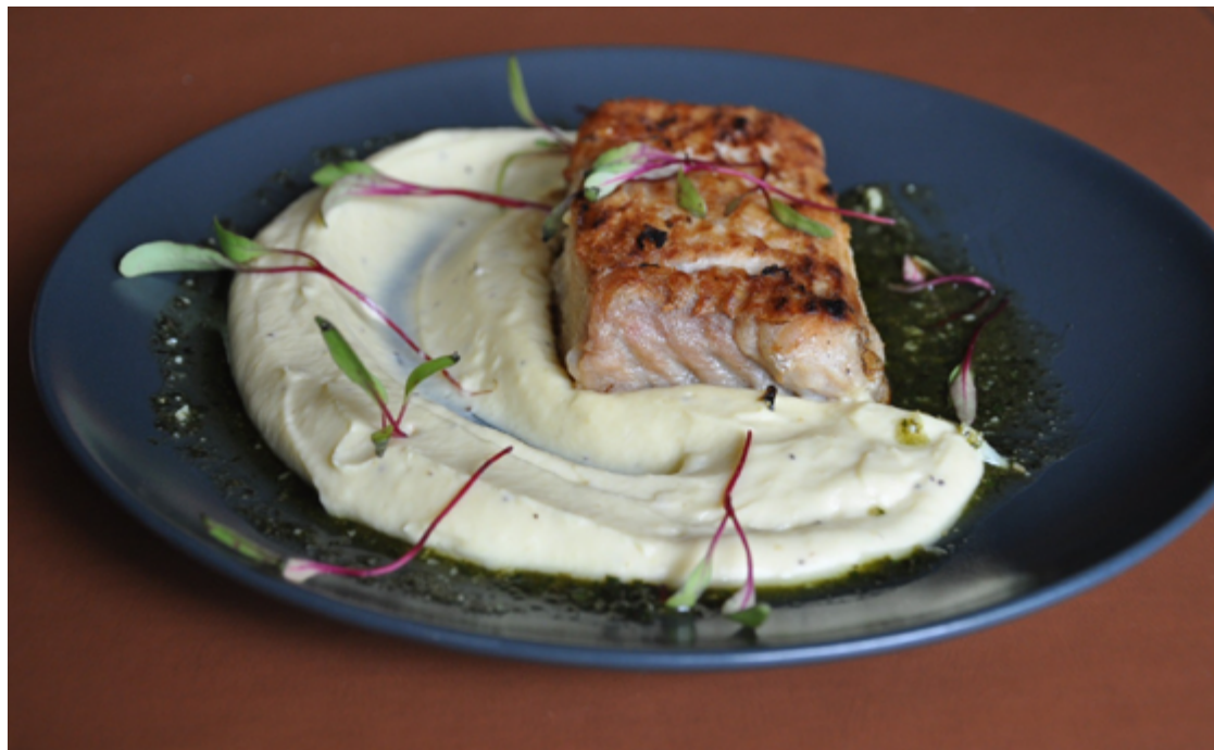
Bierre du Parc, situado no Jardim Goiás: pirarucu ao purê de banana da terra e molho pesto