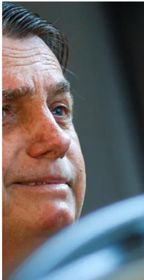
Jair Bolsonaro (PL)

O bolsonarismo é muito forte em Anápolis, principalmente em razão do forte apelo eleito-