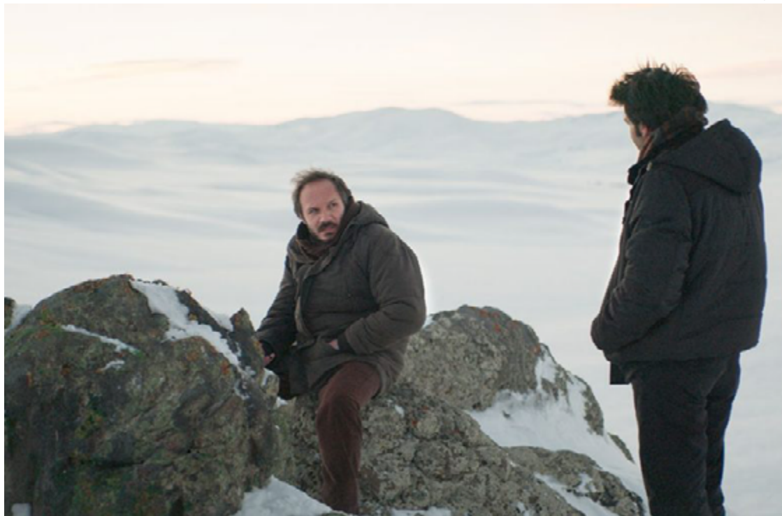
Cenário congelante: paisagem gélida corrobora para sentimento de desalento