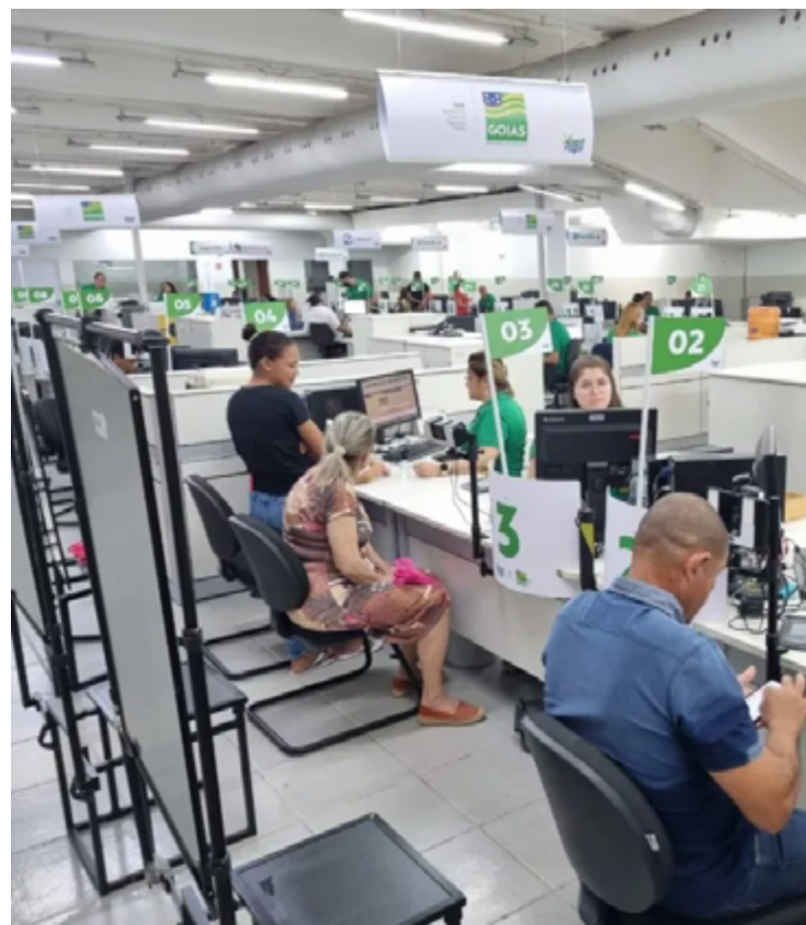
As agências Vapt Vupt em todo o estado terão funcionamento alterado durante a Semana Santa

lação (AGR) manterá o atendimento aos usuários dos serviços de saneamento básico, energia elétrica, transporte intermunicipal de passageiros, terminais rodoviários e outros bens desestatizados pelos seus canais eletrônicos (e-mail: ouvidoria@agr.go.gov.br e site: www.agr.go.gov.br/ouvidoria) durante o feriado prolongado.