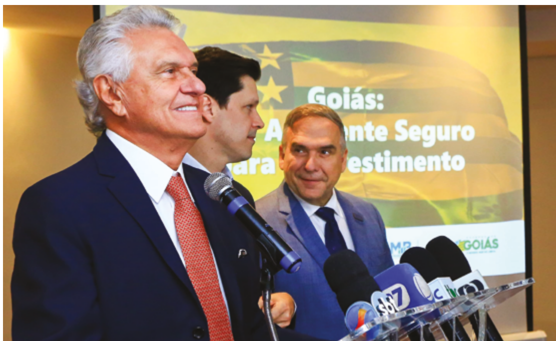
“Estamos colocando Goiás no patamar que ele merece”, disse Ronaldo Caiado na divulgação das projeções

“Estamos colocando Goiás no patamar que ele merece. Criamos uma mentalidade, uma conduta de atingir metas cada vez mais altas. Buscamos dar liberdade econômica ao estado, facilitar a vida do empresário, diminuir a burocracia e dar eficiência, atendendo aqueles que geram emprego”, afirmou Caiado. Ao comemorar o resultado, ele ainda reforçou que trabalha para que Goiás seja “não só um estado competitivo, mas com a melhor qualidade de vida para a população”.