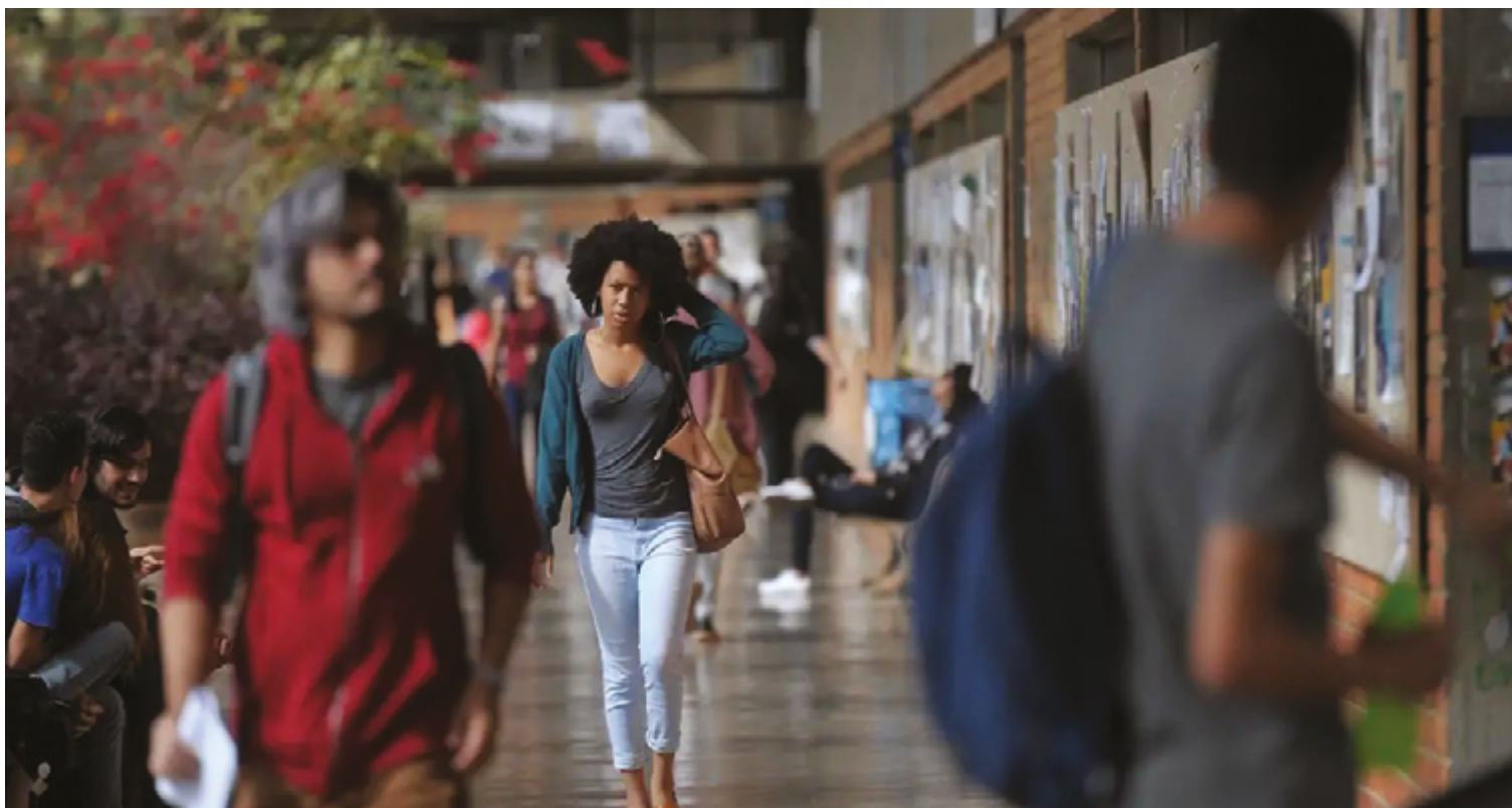
Proporção de mulheres brancas que completam ensino superior é de 29%, número que representa o dobro de pretas ou pardas, que somam 14,7%

“Pensando principalmente no mercado de trabalho, sobretudo no corpo docente das universidades brasileiras, falamos em racismo institucional. Então, será que essas universidades estão respeitando a lei de cotas? Como é que homens negros e mulheres negras vivenciam aquele espaço pedagógico? Como professores, técnicos ad-