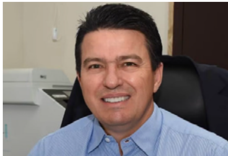
Aleomar Rezende: busca do segundo mandato