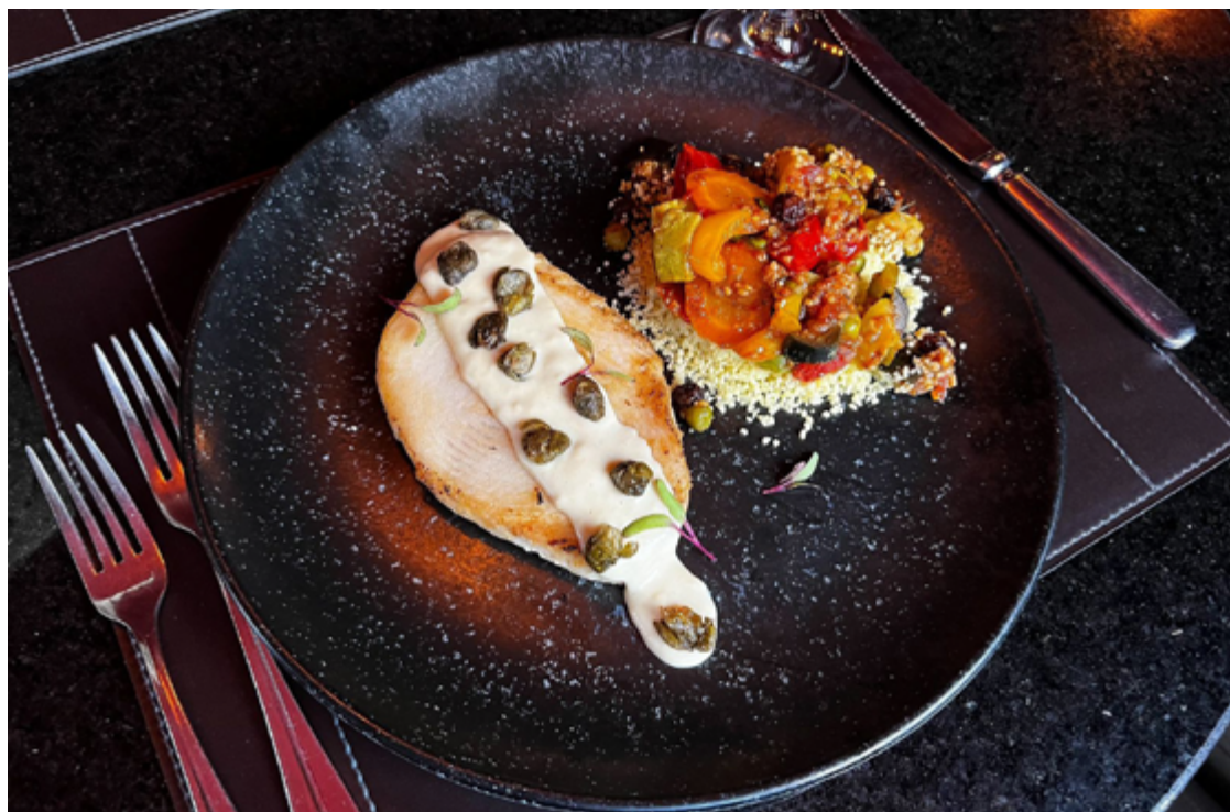
L'Étoile, no Setor Marista: pirarucu grelhado na parrilla

gumes. No jantar, há croquete de bacalhau e salmão com camarão como entrada, seguido por pirarucu grelhado na parrilla, também com couscous marroquino e legumes.