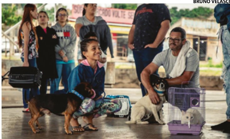
Retorno do Castramóvel mobilizou os tutores que levaram seus animais

Também houve cadastro para castração e vacinação contra a raiva para animais com idade acima de três meses. A próxima data de ação do Castramóvel será anunciada em breve. A recomendação é que todos estejam em jejum de água e comida por 12 horas.