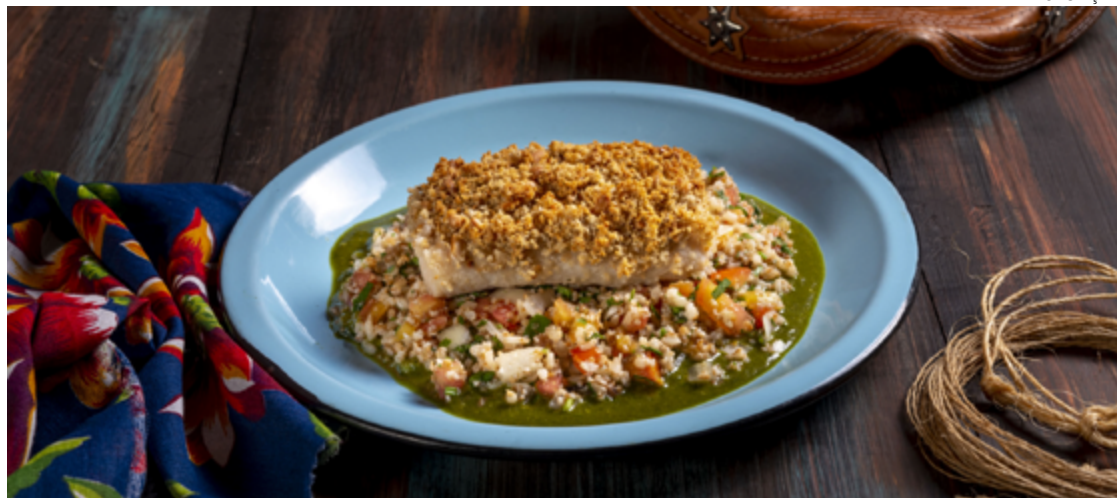
Piry, restaurante localizado no Jardim América: pintado crocante

No Setor Marista, o L'Étoile D'Argent traz menus com peixe para almoço e jantar durante sexta, sábado e domingo. O almoço inclui filé de tilápia grelhado com molho dijonnais e alcáparas, acompanhado de couscous marroquino e le-