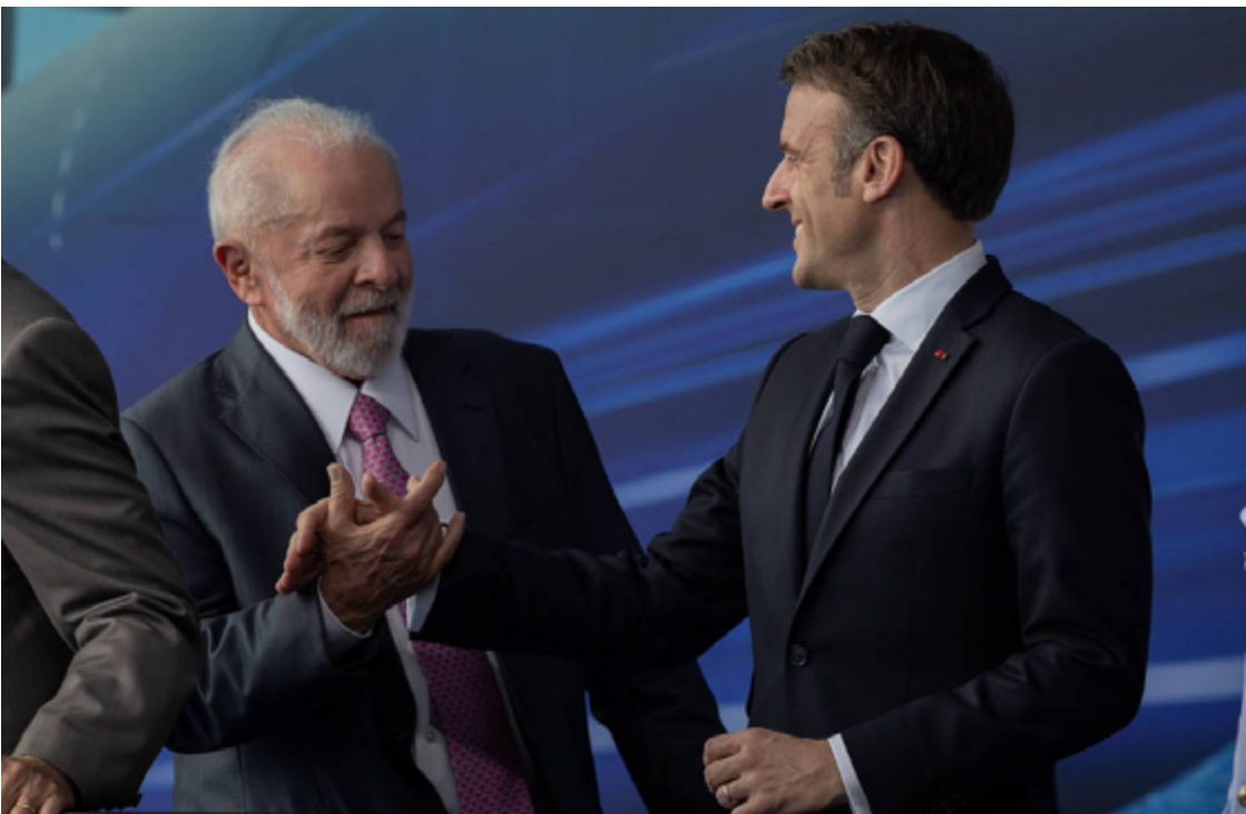
Lula da Silva e Emmanuel Macron: acordos e parcerias sobre meio ambiente e paz mundial

“O presidente Macron e eu concordamos em ampliar esse