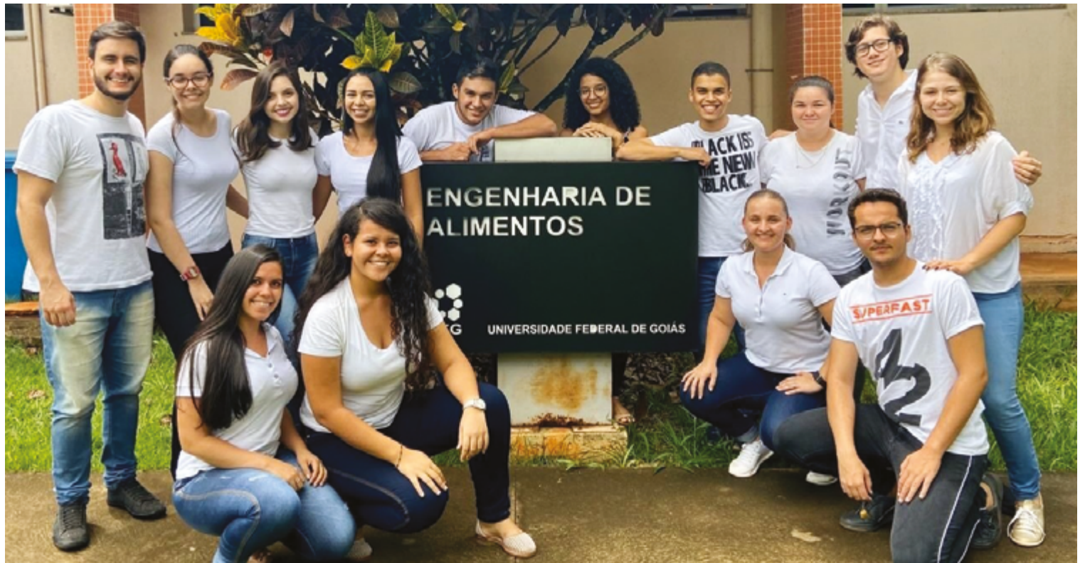
Mulheres são 60,3% dos concluintes dos cursos presenciais de graduação, mas, mesmo assim, estão sub-representadas em determinadas áreas

Para aquelas que desejam seguir esse caminho, digo que ele é muito bonito. Trabalhar com alimentos é pensar no bem-estar das pessoas, na manutenção de sua saúde e que um produto pode chegar a longas distâncias e pro-