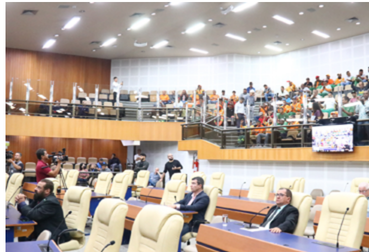
Plenário da Câmara Municipal de Goiânia

O Tribunal Regional Eleitoral de Goiás (TRE-GO) agendou nova totalização de votos em Goiânia para 5 de abril, às 9h30, “em decorrência de atualizações de registros de candidatura pendentes”. A decisão ocorre após o Tribunal Superior Eleitoral (TSE) comunicar à secretaria judiciária do TRE, na última quinta (21), para “adoção das providências necessárias” de decisões da justiça eleitoral, que prevê o afastamento do mandato dos vereadores do PTC (atualmente Agir) e PMB na Câmara Municipal.