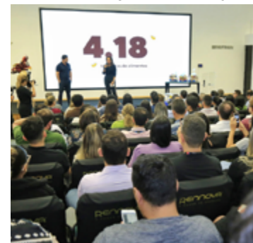
“Páscoa solidária”: OVG recebe doação de alimentos não perecíveis e leite longa vida